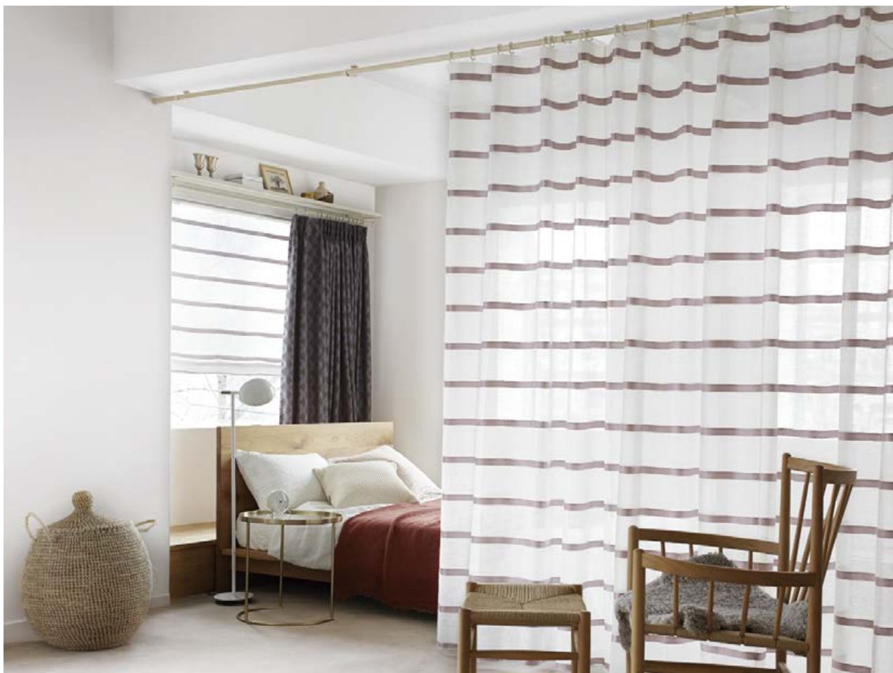
スタンドライト/コイズミ照明(AT43718L)