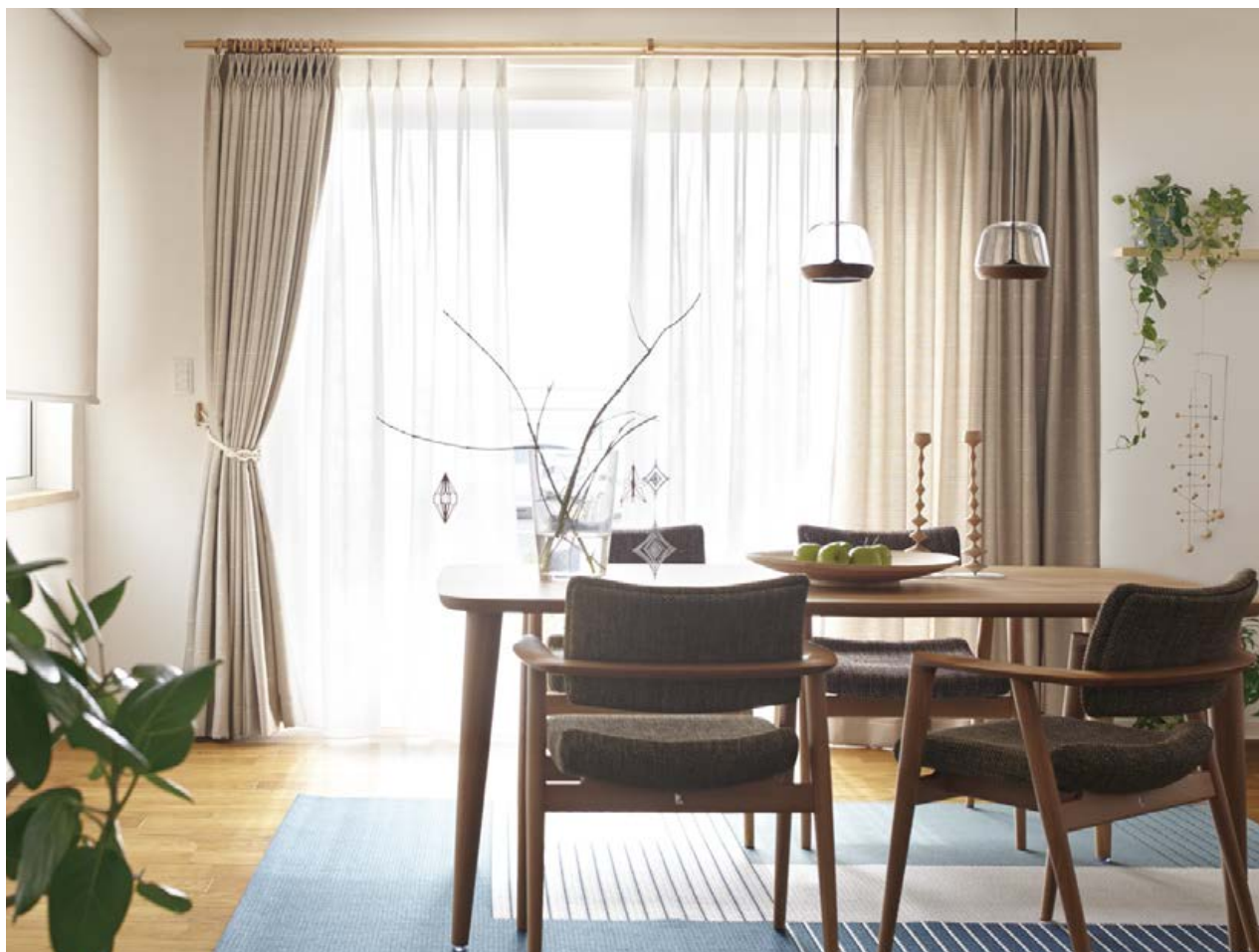
ダイニングテーブル/飛騨産業(仮オーダーテーブルHTS2) チェア/飛騨産業(SEOTO-EX LDアームチェアKX260AN) ペンダントライト/コイズミ照明(ペンダントAP47553L)