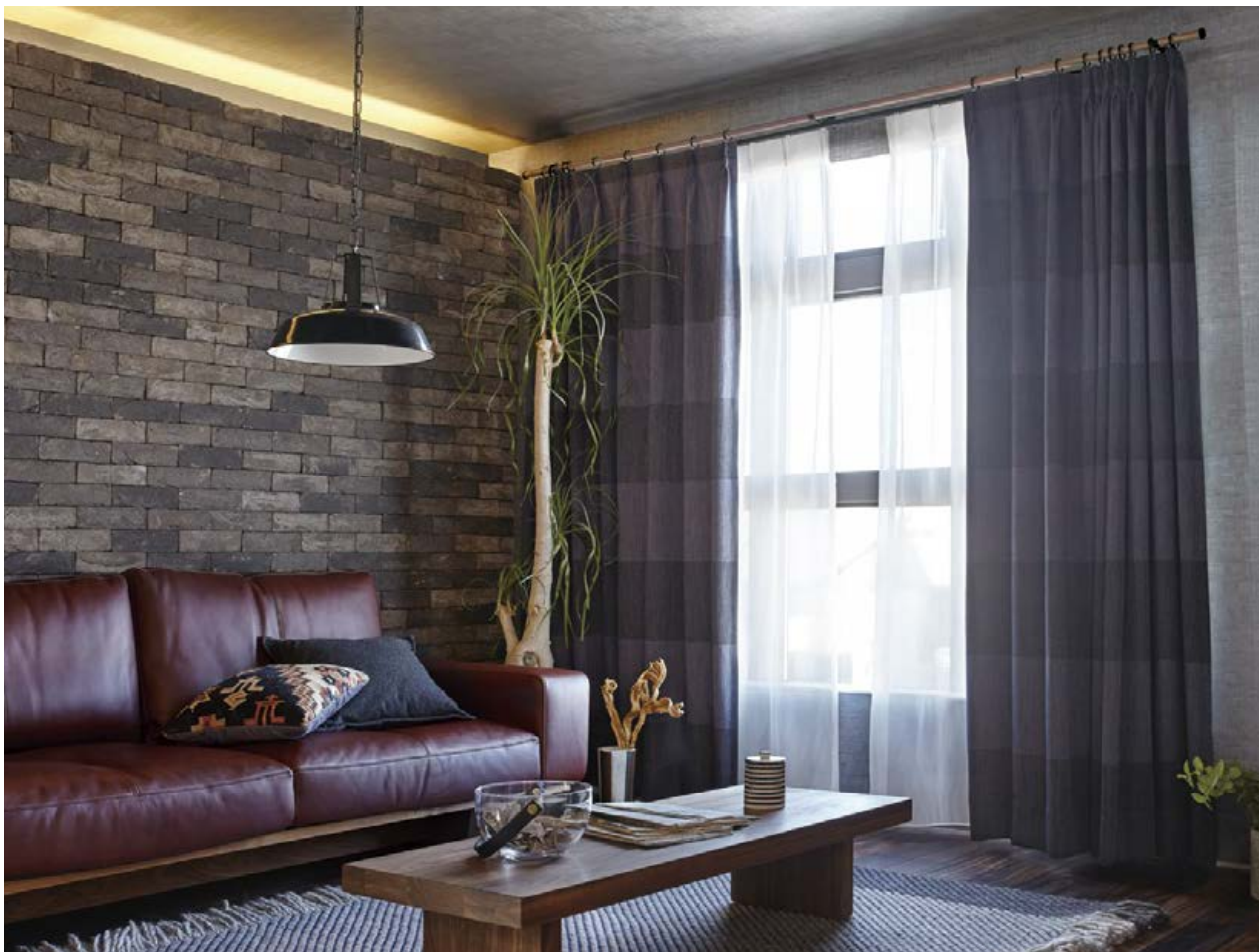
3シーターソファ/マスターウォール (MONO アームソファ MNSO-AM35220-WN) リビングテーブル/マスターウォール (DANISH ローリビングテーブル DNLT4530-WN)