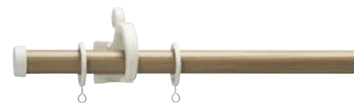
ルブラン22/エルムライト&ラテホワイト/Aキャップ