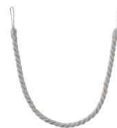
タッセル/ WC65/シルバー