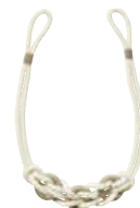
タッセル/ UC75/オフホワイト