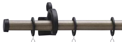
ルプラン22/エルムダーク&ブラック/Aキャップ